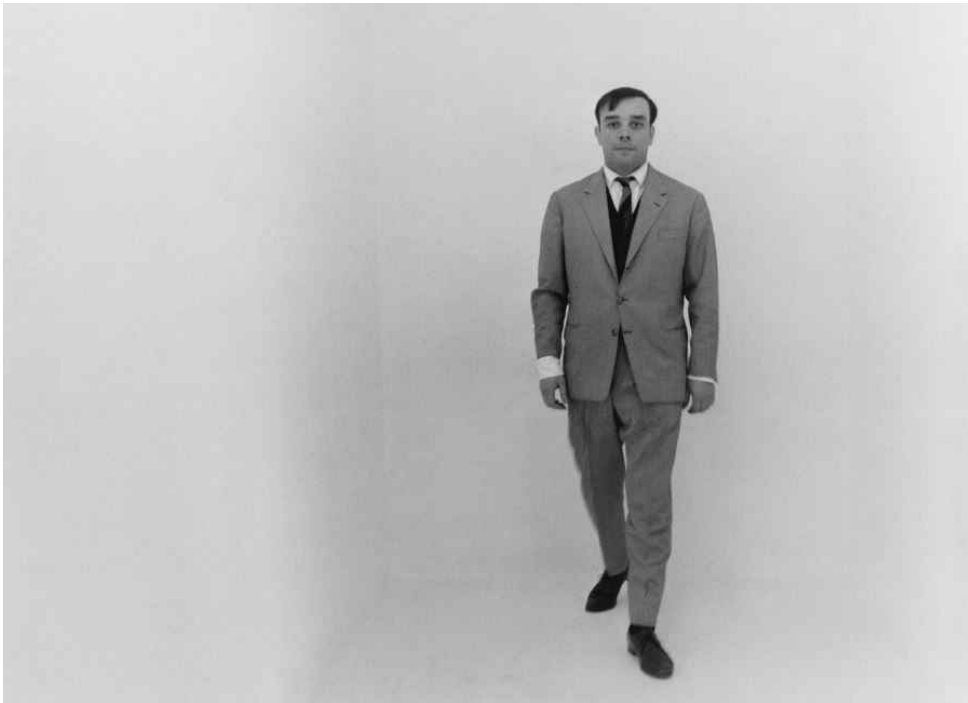
© Charles Wilp / BPK, Berlin © Succession Yves Klein v/OADAGE Paris